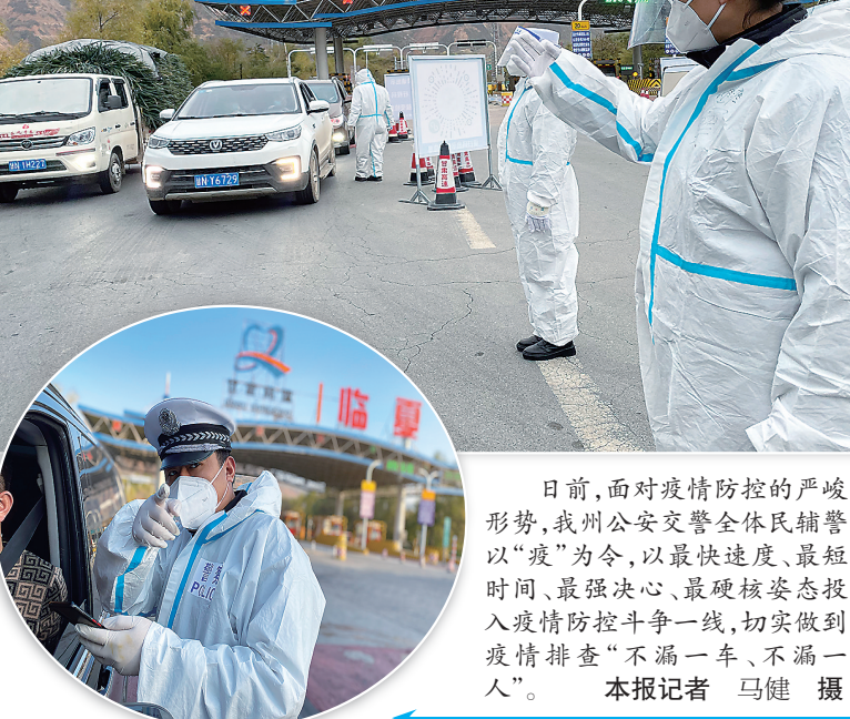
日前, 面對疫情防控的嚴峻形勢, 我州公安交警全體民輔警以“疫”為令, 以最快速度、最短時間、最強決心、最硬姿態投入疫情防控第一線...