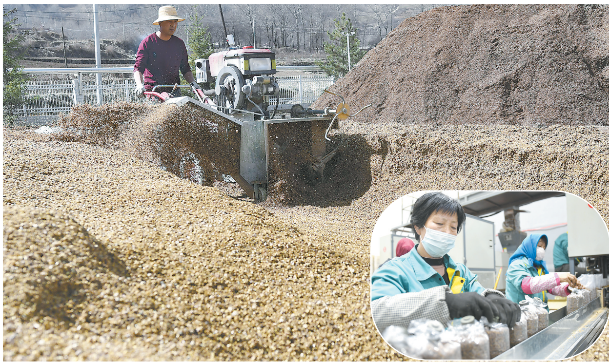
3月16日,在和政县夏润农业食用菌培育工厂内,工人们忙着制种、接种、搬运,供应市场。近年来,该县通过引进食用菌龙头企业,实现食用菌智能化、工厂化、标准化生产。今春可向周边地区提供食用菌培育菌棒400万棒,有效推进食用菌产业化发展。

本报讯(记者 陈礼娟)近日,记者从相关部门了解到,今年我州计划完成营造林35万亩,其中新造林12.1万亩、国土绿化提升改造17.2万亩、退化林修复4万亩、封山育林1.7万亩;公路沿线绿化美化1073公里。同时,推广林下种植食用菌、中药材0.5万亩;利用林地4000亩推广林下养鸡80万只,利用林地1000亩推广林下养羊2万只,发展“林家乐”(森林人家)10家。全州计划推广花椒、核桃、啤特果、油桃、苹果树等经济林林下种植甘蓝、辣椒、大蒜、萝卜、赤松茸、羊肚菌、紫花苜蓿、红豆草等5000亩。 截至3月中旬,全州完成工程整地1.28万亩,造林210.6亩。其中,永靖县三塬镇后山、刘兰公路面山已完成整地工程11352亩,完成造林210.6亩,陡削坡绿化20.14万平方米,栽植油松、云杉、花椒、刺槐、红柳和花灌木等62.82万株;临夏市铜匠庄、马彦庄面山完成整地350亩;广河县三甲集甘坪已整地500亩;康乐县草滩乡造林点整地300亩;东乡县沿刘家峡库区面山整地300亩。同时,公路沿线绿化美化整地58公里,栽植法桐3公里、876株。