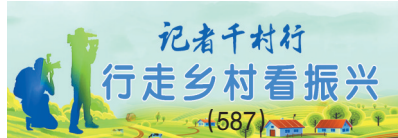
记者千村行 行走乡村看振兴 (587)

3月14日,记者前往上王家村采访,该村220多户回族、东乡族和60多户汉族群众互敬互爱,和睦相处,连年