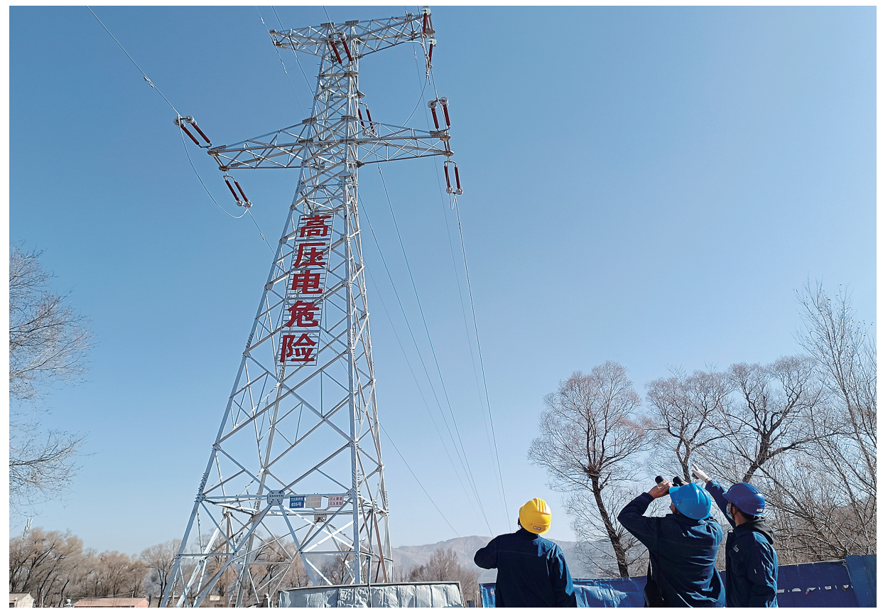
自3月10日开始,国网临夏供电公司输电运检中心加强对线路隐患的排查治理,针对线路通道内有施工区域的路段逐条进行特巡,确保线路稳定运行。