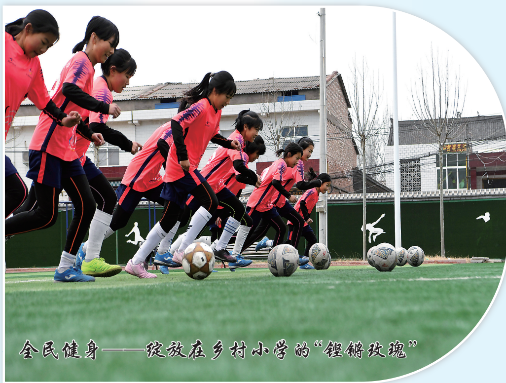
全民健身——绽放在乡村小学的“铿锵玫瑰”