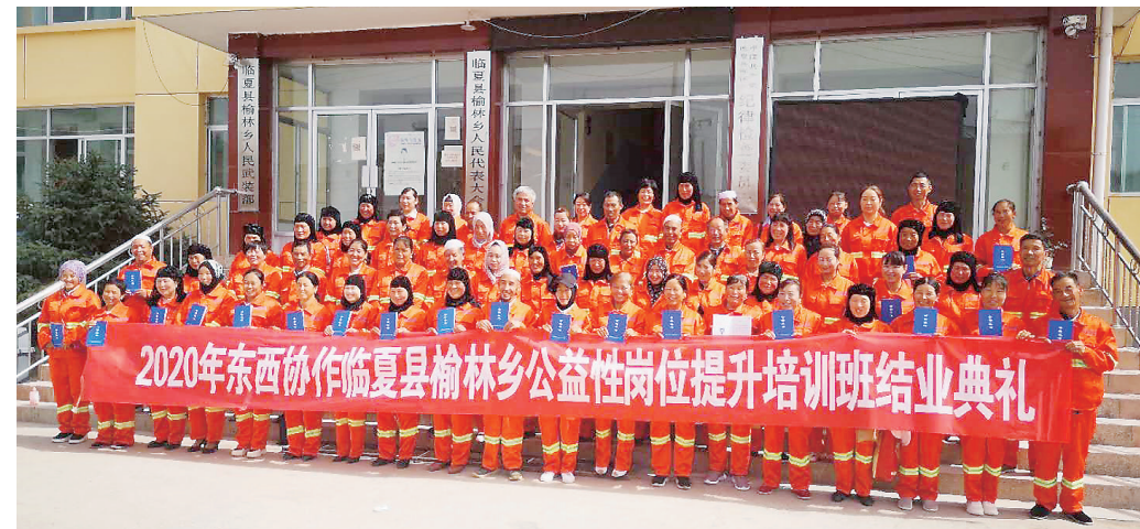
为各民族公益性岗位人员提供岗位培训

在我州,做好人社工作,就是为全州民族团结进步夯实社会基础。为全州各族人民谋福祉,为各族群众提供优质服务,让各族群众更好地享受到国家的惠民政策,是州人社局在铸牢中华民族共同体意识中永恒的作为。