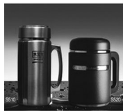
高档养生系列 S510 S520