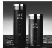
至尊极品系列 V608 V808