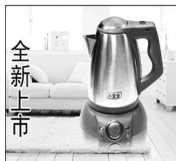
智能微电解制水壶 A420