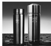
中档健体系列 U306 U308